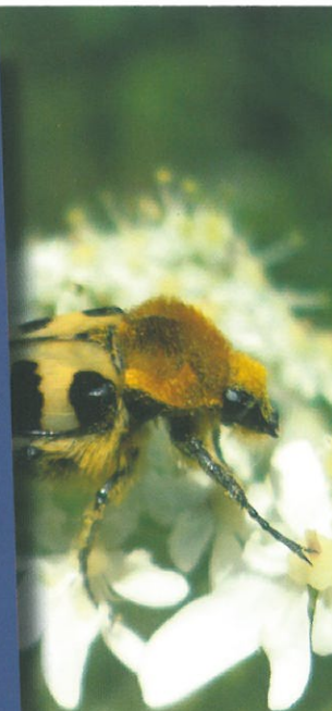
Trichius rosaceus ou tricki