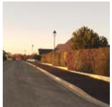
Lotissement de la Horgne

Entreprises : Lochard Beaucé, Hardy Pavage bordure, Au cœur des Jardins