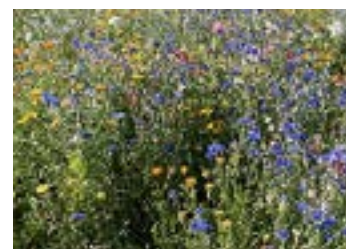
Après les semailles, la floraison...