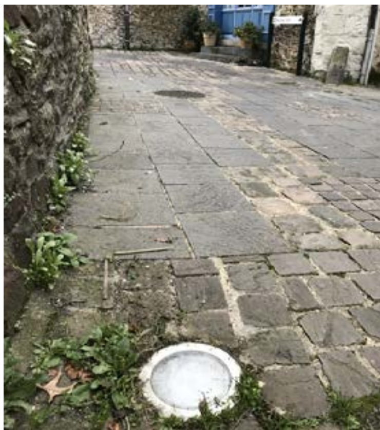
Rénovation de l'éclairage au sol