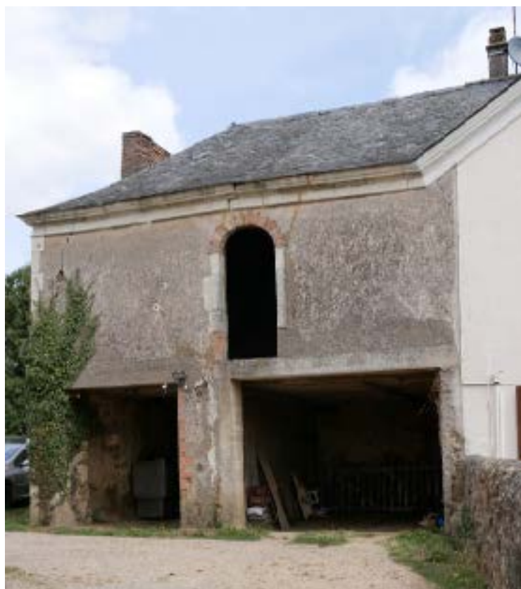
Création d'une voie douce

Menés par la Communauté de Communes du Pays de Château-Gontier, désormais compétente en la matière, différents chantiers seront conduits sur la commune en 2021 dans le cadre d'un programme de renouvellement des réseaux d'eau potable trop anciens. De janvier à mars, le chantier démarrera par la rue de l'Eglise pour aller vers la rue des Halles puis vers la Pilardière. Plus tard dans l'année, seront menés des chantiers sur le haut de la route de Sablé et rue des Vignerons. Ces travaux, financés par le Pays de Château-Gontier, le Département et l'Agence de l'Eau Loire-Bretagne, sont réalisés par l'entreprise Eurovia. Les riverains seront informés directement par les services de la Communauté de Communes des dates d'intervention ; Eurovia communiquera sur les éventuelles perturbations notamment pour la collecte des ordures ménagères ou encore en cas de coupures d'eau nécessaires aux raccordements.